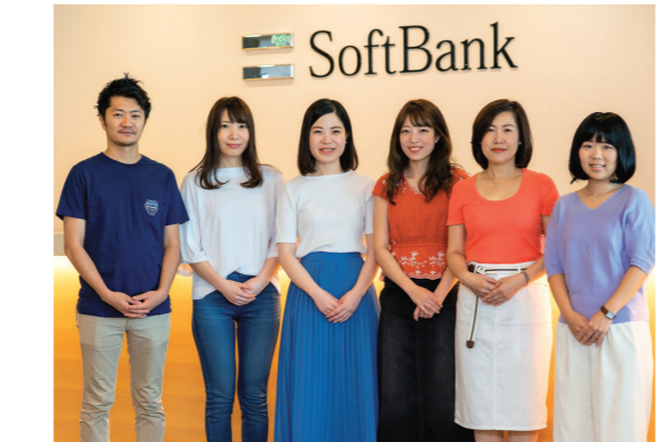
人事部 障がい者採用担当一同