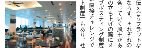
見晴らしもよく、まるでフードコートのような社員食堂は、打ち合わせにも使われるなど社員に人気。

お互いに意見を伝え合うフラットな環境です。社員が横並びにならず、それぞれの個性を尊重しながら高め合っていく風土があります。新規事業などの立ち上げの際にメンバーを公募する「ジョブポスティング制度」や、異動希望の部署に直接チャレンジできる「フリーエージェンツ制度」もあり、社員に自己実現の機会を提供し、一人ひとりが夢や目標に向かってキャリアを築いていける環境を整えています。