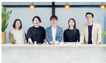
リクルート&キャリアアクリエイトセンター

新たなグループ体制においても、こうした組織のメンタリティを先輩から後輩にしっかりと伝承しながら、仕事を通じて一人ひとりが飽くなき挑戦を続け、そして社員の成長がさらにお客様からの信頼を高めていく、そういう経営の姿をめざしていきます。当社のごような思いに共感いただける方、ご応募をお待ちしております。